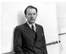
Klaus Mann an Bord eines Schiffes bei seiner Ankunft in New York City, 1938