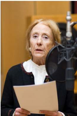
Rosemarie Fendel im MDR-Hörspielstudio