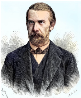
Wilhelm Raabe