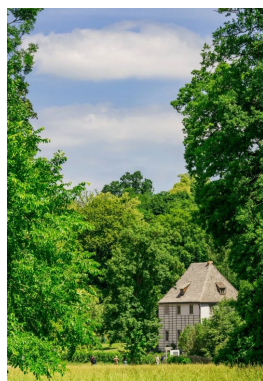
Goethes Gartenhaus in Weimarer Ilm-Park