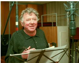
Kurt Böwe bei einer Produktion im MDR-Hörspielstudio 2010