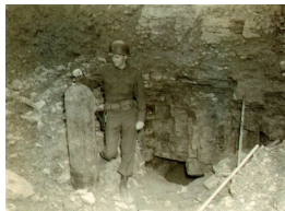
Nach der Befreiung im Steinbruch des KZ Buchenwald: Amerikanische Soldaten öffnen geheime Bunker

Regie: Nikolai von Koslowski | Mit: Lisa Hrdina, Walter Renneisen und Udo Schenk