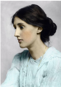
Virginia Woolf